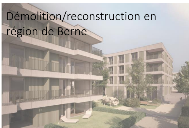
Démolition/reconstruction en région de Berne