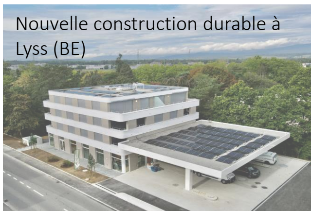
Nouvelle construction durable à Lyss (BE)

Achats et développements à partir du parc existant