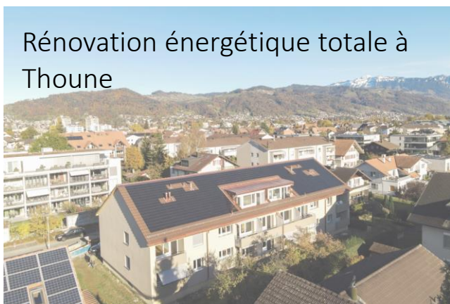
Rénovation énergétique totale à Thounne